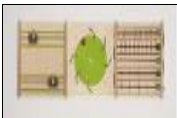
Набор звучащих панелей 1.

Специализированное оборудование для детей с нарушениями слуха